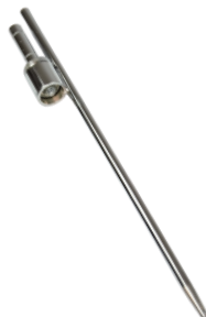
Markspjut Gräs, Sand